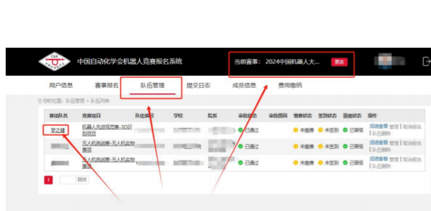
报名成员排列顺序查询 1

8. 晋级至“国赛”参赛队伍报名者，在晋级成功后，务必再次确认所有参赛人员的排列顺序。相关信息会在参赛证件、获奖证书等重要比赛文件中体现；