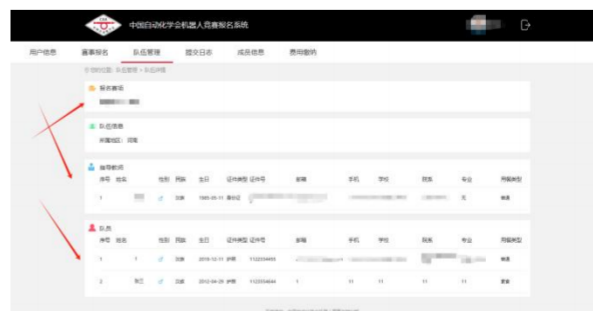
报名成员排列顺序查询 2