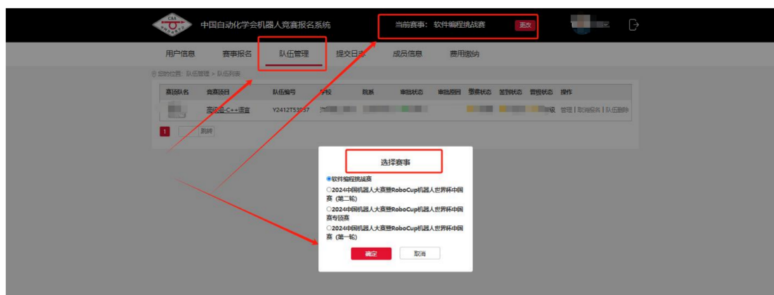
晋级赛队赛事切换

4、晋级审核通过的赛队报名者可以于2025年3月26日至3月30日登陆报名系统，选择“当前赛事”-“队伍管理”-“选择赛事”切换至“国赛”，即可查看晋级赛队情况。届时可对队伍成员进行调整，上传免责声明。组委会将同步进行报名审核；